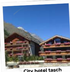
City hotel tasch